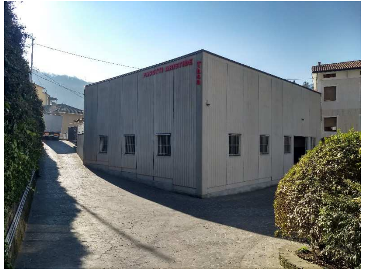
Foto n. 3 - Piazzale interno