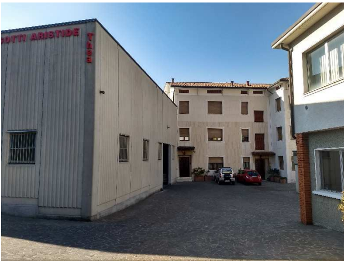
Foto n. 4 - Ingresso capannone