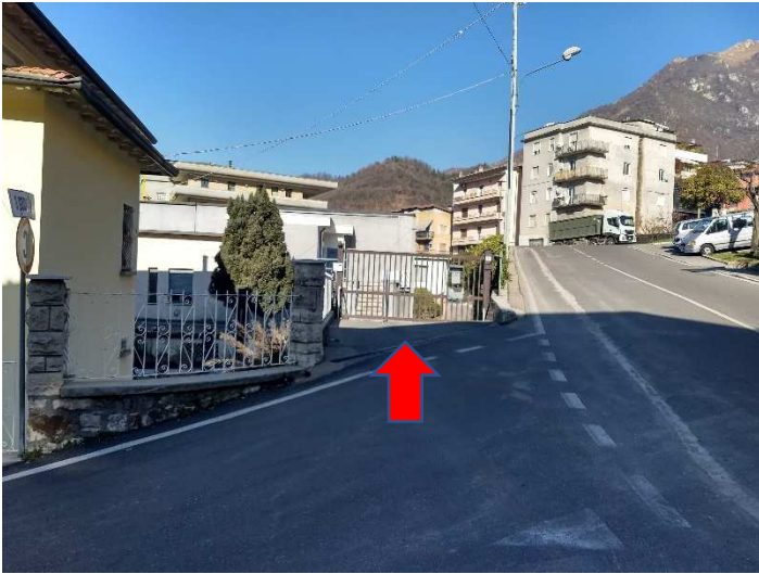
Foto n. 2 - rampa di accesso